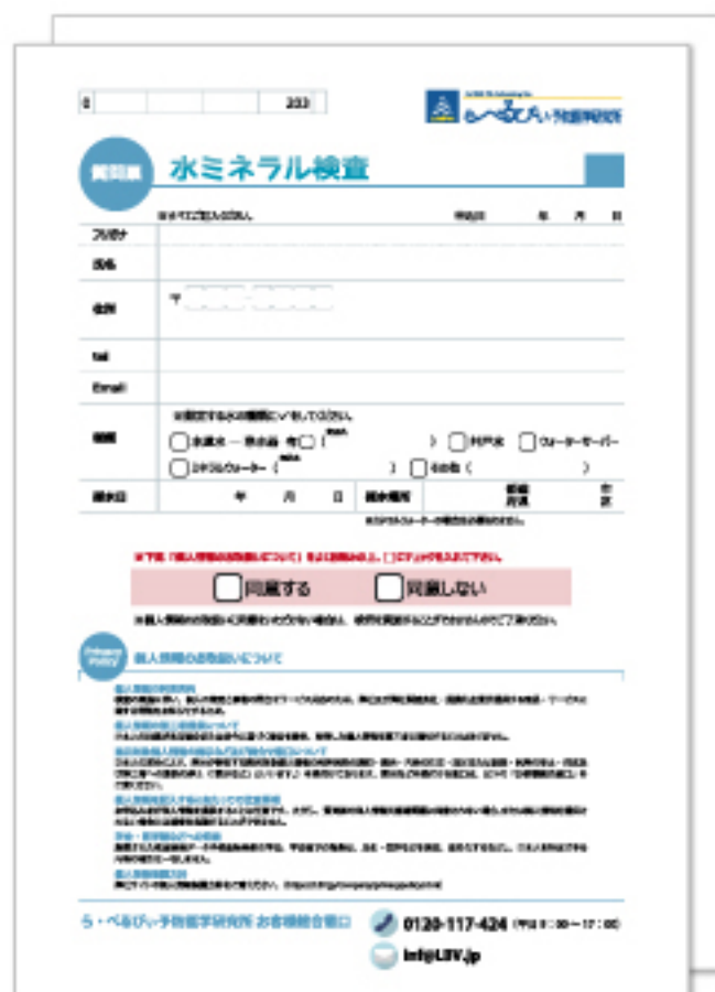
① 質問票 採水方法