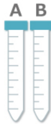
② 15ml 検査容器 A 1本 15ml 検査容器 B 1本